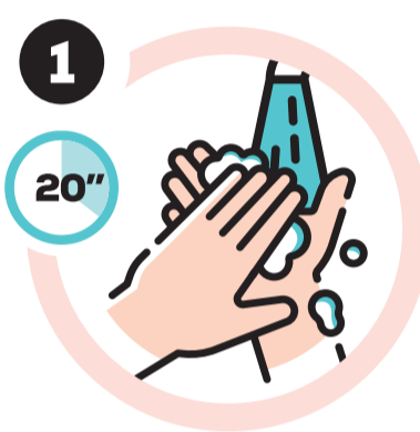
Lavar as mãos