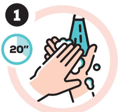
Lavar as mãos