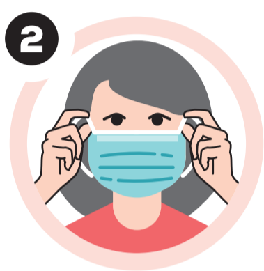
Na posição correta, segurar a máscara pelos atilhos/elásticos e voltá-la para a cara