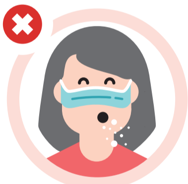
Não retirar a máscara para tossir ou espirrar