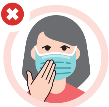
Não tocar nos olhos, cara ou máscara