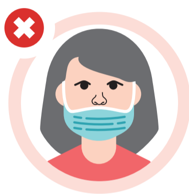
Não usar a máscara com a boca ou o nariz desprotegidos