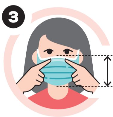
Ajustar ao rosto, cobrindo do nariz até abaixo do queixo