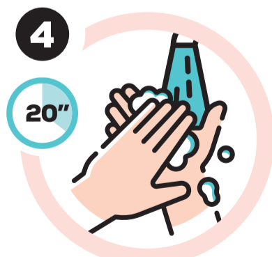
Lavar as mãos