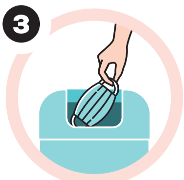
Colocar no caixote do lixo sem tocar na parte da frente da máscara