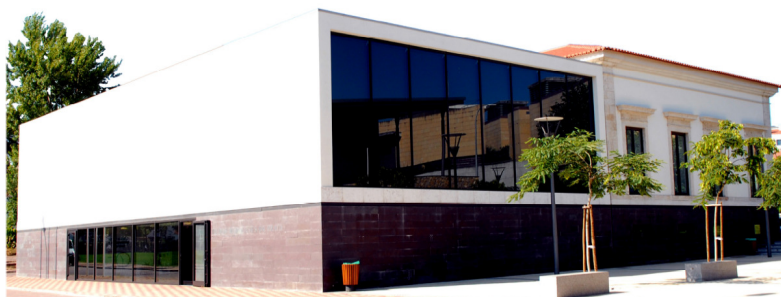
ASSEMBLEIA MUNICIPAL DE LOURES